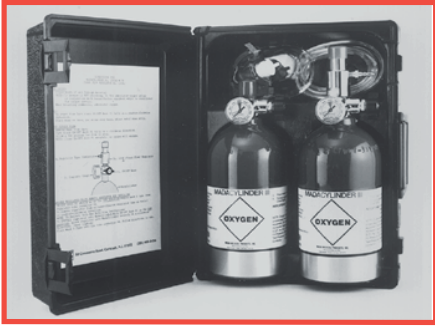
No. 1300ME Oxy-Uni-Pak (2) 1303ME MadaCylinder III's, 1308A regulador de flujo fijo (6 LPM Avg.) máscara, tubo y maletín para transporte.