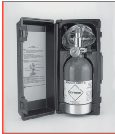
No. 1301ME Oxy-Uni-Pak Contiene: Un 1303ME MadaCylinder III, 1308A regulador de flujo fijo (6 LPM Avg.) máscara y tubo en un maletín para transporte.