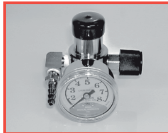
No. 1309A Regulador de flujo ajustable (2 - 8 LPM) con rosca CGA-540, fácil de atornillar manualmente a las válvulas Mada en el cilindro. También disponible como 1309A-1 (1/16 - 1 LPM), 1309A-5 (1/2 - 5 LPM) y 1309A-15 (2 - 15 LPM).

Para ordenar unidades llenas de oxígeno, remover el sufijo "E" Embarques de cilindros a la Florida deben ir vacío.