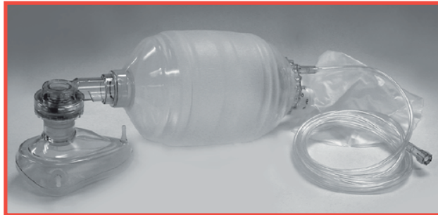
No. 1432 Resucitador Máscara resucitadora para Adulto con reserva Reutilizable. (1 unidad por caja).