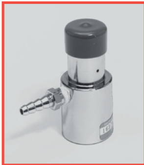
No. 1308A Regulador de flujo fijo con rosca CGA-540, fácil de atornillar manualmente a las válvulas Mada en cilindro. (6 LPM Avg.).