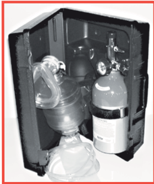
No. 1300BME Oxy-Uni-Pak Equipo de Resucitación 1303ME MadaCylinder III, 1308A regulador de flujo fijo (6 LPM Avg.), 4000X bolsa desechable para adulto, máscara resucitadora, tubo y maletín para transporte.