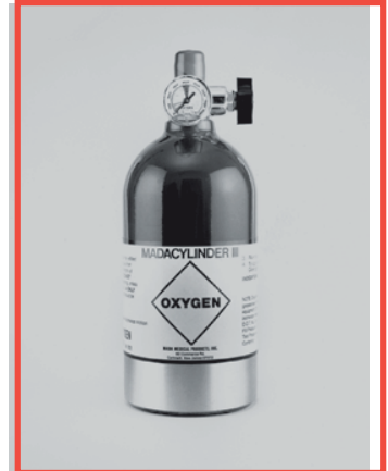
No. 1303ME MadaCylinder III Cilindro de Oxígeno Ultra-ligero con medidor incorporado al cilindro.